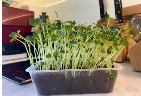
Gambar 1. Sayur Microgreen.

an fase kecambahnya 2-5 hari, fase baby green 3 – 4 minggu, fase microgreen-nya 7 – 14 hari.